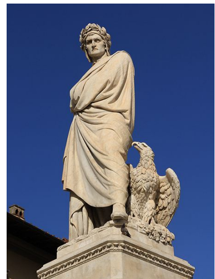
Statue de Dante Alighieri, près de Santa Croce, Florence (Italie), 1865, Enrico Pazzi